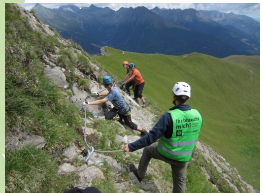
Einsatz für die Wege im Verbandsgebiet